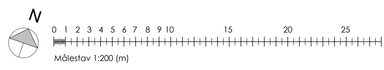
AP-1 Plan 1 1 : 200