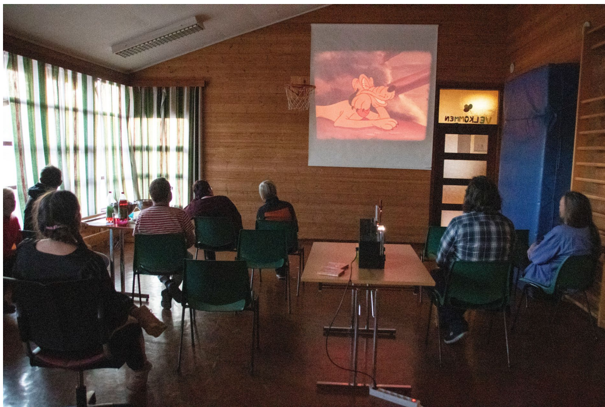
Pluto-tegnefilmen ble godt mottatt av publikum fra dagsenteret.

Fredag fikk brukerne av dagsenteret ved Miljøtjenesten på Rørvik en litt annerledes filmframvisning. Fra et lager var det nemlig funnet fram gamle 8 millimeter-filmer og en framviser og dermed ble det kinovisning på gammelmåten.