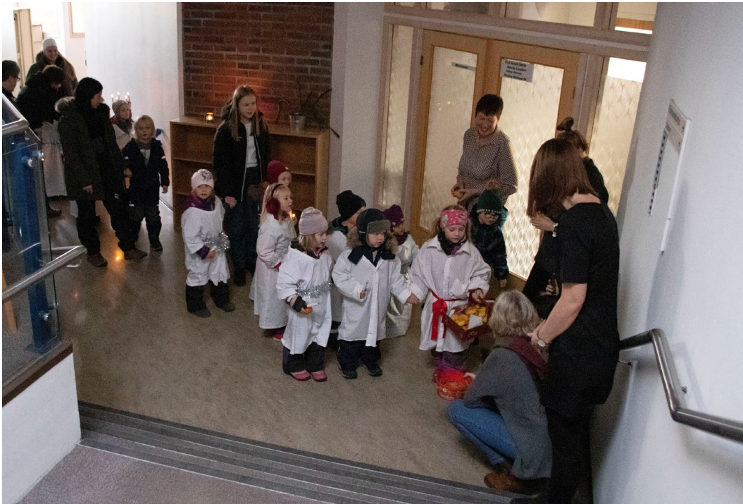
Barna fra Kolvereid barnehage sang luciasangen og serverte lussekatter til de ansatte på kommunehuset.

I dag den 13. desember er det selveste luciadagen, og flere plasser har det dukket opp luciatog. På Kommunehuset på Kolvereid dukket barn fra Kolvereid barnehage opp og sang luciasangen og spanderte lussekatter på de som jobber der. Det ble det satt stor pris på i en hektisk førjulstid.