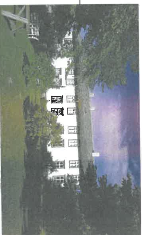
MUSEUMSOMRÅDET I RØRVIK

Som det første museet i Norge mottok Kystmuseet prisen som «Årets museum» i 1997. To ganger har museet vært nominert til "European Museum of the Year Award" og i 2005 ble Norge nominert til den prestisjetunge arkitekturprisen Mies van der Rohe Award.