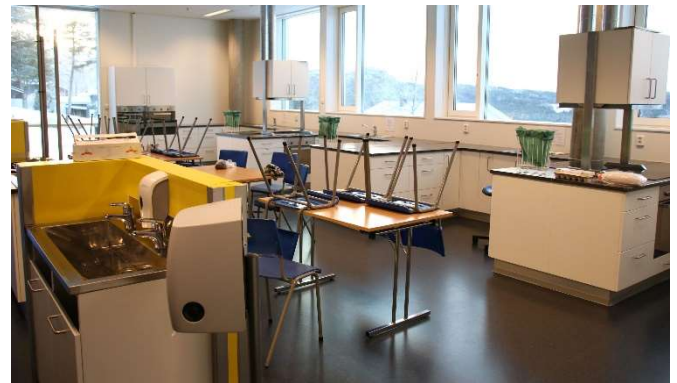
Allerede i dag er det samarbeid mellom ungdomsskolen og barneskolen ved at barneskoleelevene bruker skolekjøkkenet på ungdomsskolen. Dette vil fortsette også etter at nybygget er ferdig.

Det er også planer om at barneskoleelevene skal kunne bruke spesialrommene på ungdomsskolen i framtiden.