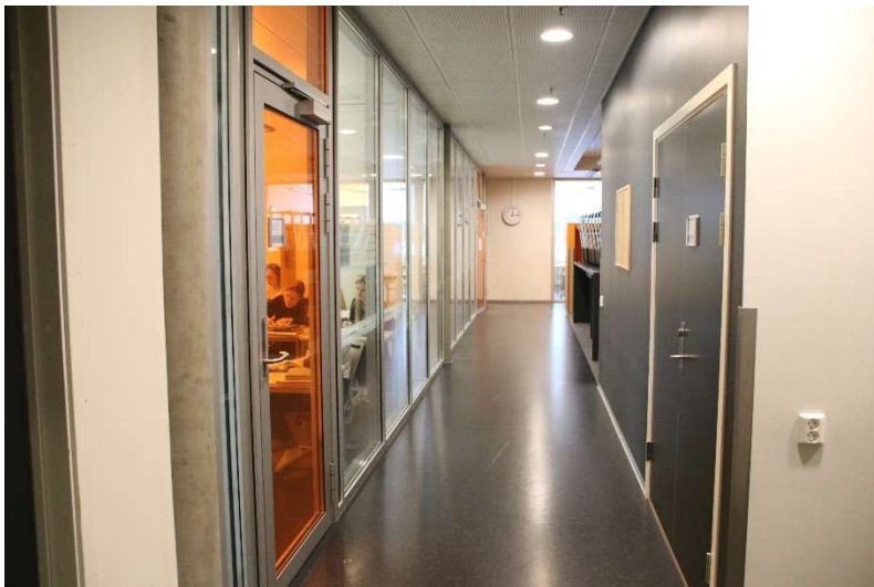
Nærøy ungdomsskole er en moderne skole hvor både elever og lærere trives. Nå skal elevene på barneskolen også få tidsriktige lokaler i samme stil.