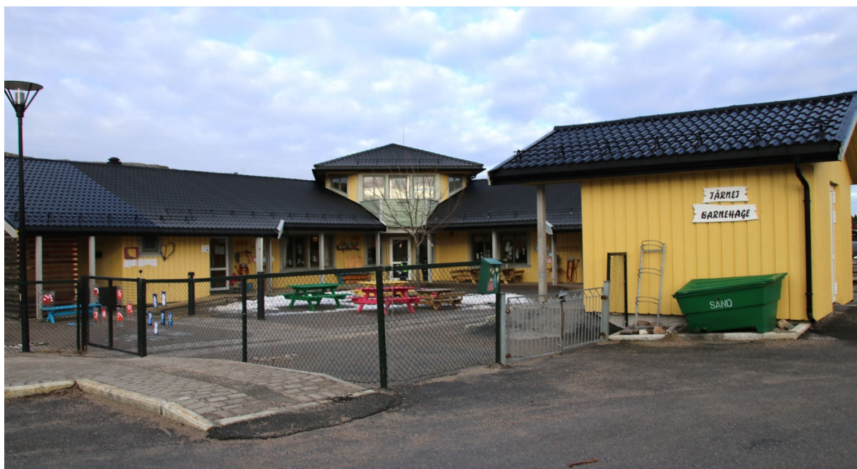
Det er fem år siden Vikna kommune samlet sin egen barnehagedrift i Rørvik ved Tårnet. De seksti barna i barnehagen har et godt uteområde å boltre seg på, samt gode forhold inne i barnehagen som har tre baser.

Så mye tid på det flotte personalrommet med god utsikt blir det derimot ikke for de ansatte. De tilbringer det meste av tiden sammen med barna, enten inne på basene eller ute. Det legges opp til at barna er ute og inne på skift etter faste rutiner. Ute så har barna for øvrig et godt tilrettelagt lekeområde med mange trær og et lett kupert terreng hvor det er gode muligheter til å leke året rundt.