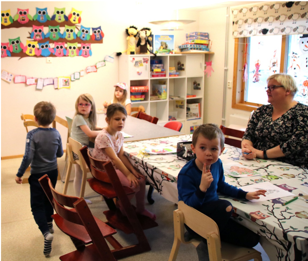
Både voksne og barn trives godt i Tårnet barnehage i Rørvik.

I nyhetsbrevene framover så vil vi fokusere på de mange ulike enhetene i det som skal bli Nærøysund kommune. Dette for alle som jobber i den nye kommunen skal bli bedre kjent med hele den nye organisasjonen der det jobber nesten 1000 personer, fordelt på rundt førti enheter.