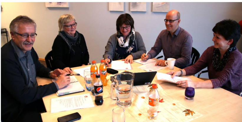
De ansatte på Nav jobbet med ulike oppgaver i grupper for å forberede sammenslåingen.

Det er ennå ikke avgjort hvor Nav Nærøysund skal samles i felles lokaler.