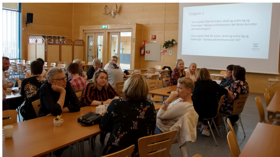
Deltakerne på workshopen ble utfordret til å svare på spørsmål om kulturbygging i Nærøysund kommune.