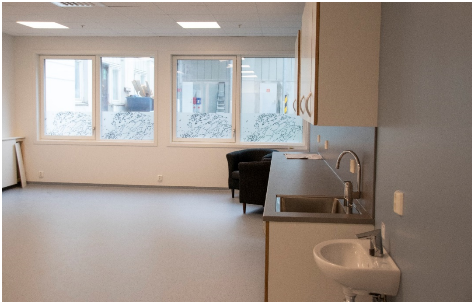
Dette blir det nye dialyserommet. Lokalet som har vært brukt til dette fram til nå inne på den gamle sykestua skal bygges om til ny bruk.

Rørvik Helsesenter blir bygd sammen med Sykestua. Også deler av denne er ombygd eller skal ombygges i forbindelse med «Helse for framtida». Helsesenteret er del to i «Helse for Framtida». Del