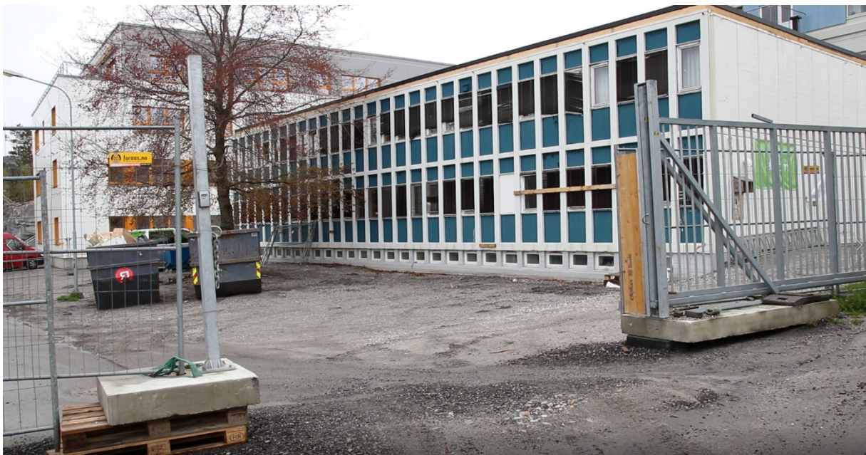
Det gamle helsehuset i Rørvik har snart sett sine siste dager. Etter mer enn femti år i bygget så flytter helsestasjonen nå ut. Når de og de andre ansatte har flyttet over i nybygget så vil huset fjernes.

Både familieterapeuten og mange andre oppgaver som helsestasjonen jobber med handler om forebygging. Det er et område som alle de ansatte ved helsestasjonen har et fokus på.