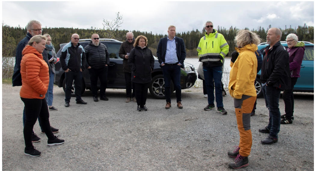
Innbyggerne på nordsiden av Horvereidvatnet ønsker redusert fartsgrense på strekningen mellom Mulstad og Nakling. 80-sone og autovern gjør det farlig å gå langs veien.

lokalbefolkningen å få Vegvesenet til å ha gatelysene tent. De siste fem årene har lokalbefolkningen kostet dette, men innbyggerne mener at ettersom skolebarn i området går til gamle Fikkan skole for å bli hentet der av skolebuss så er dette fortsatt en skolevei og derfor må lysene være tent. Vegvesenet