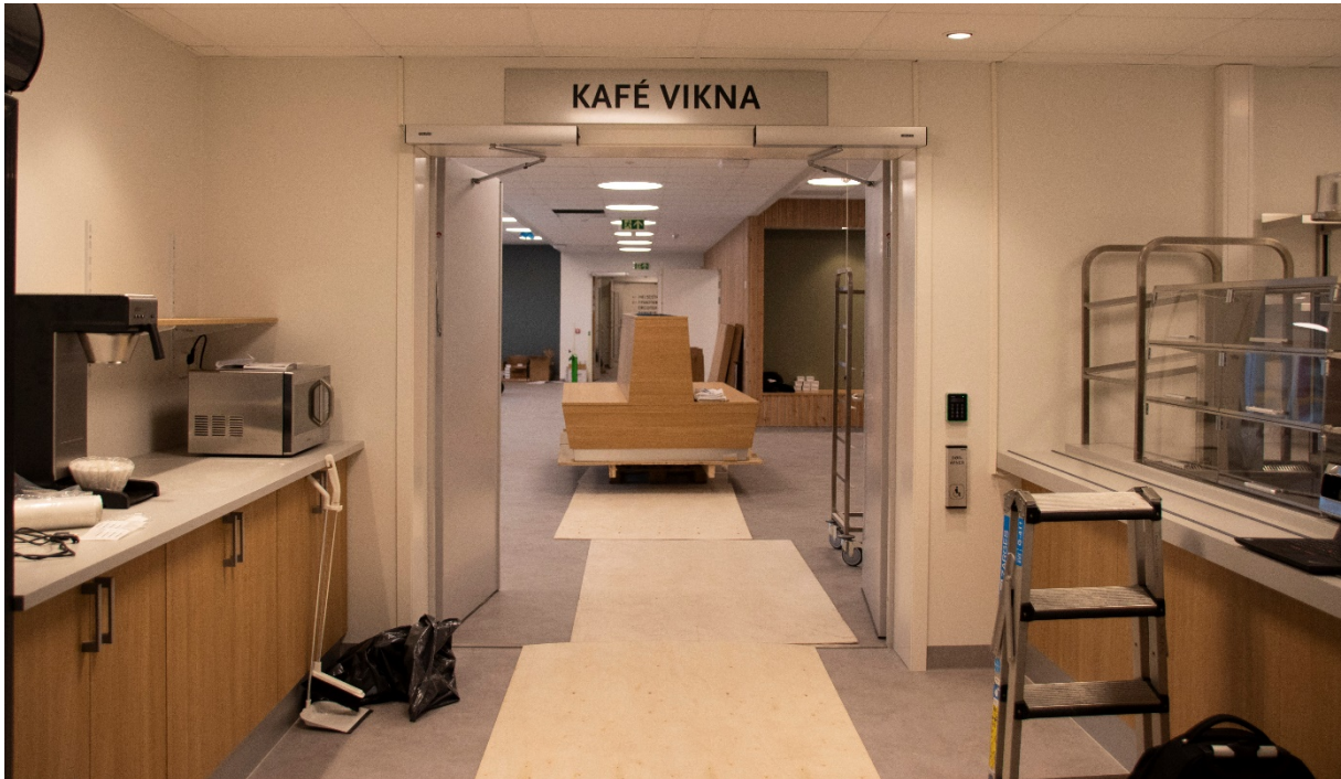
Kafé Vikna skal bli den nye møteplassen i bygget. Dette er en kombinert kantine, spiserom og åpen kafé.

moderne og egnede lokaler enn de har hatt fram til nå. Dette er en del av satsingen «Helse for framtida» i Vikna.