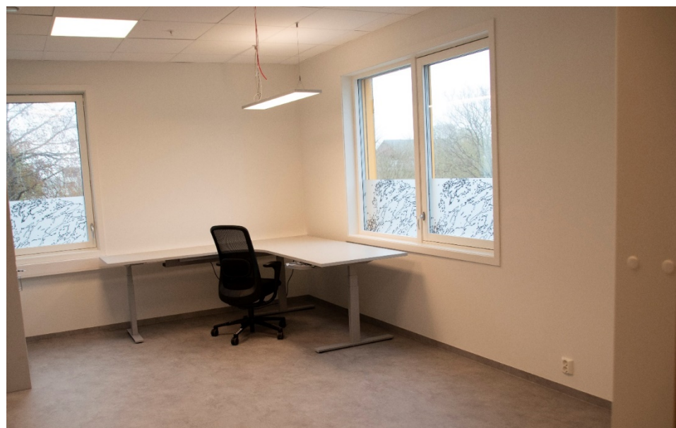
Kontorene i Rørvik Helsecenter er klar for innflytting. I løpet av onsdag skal kontorene være i bruk for både leger, helsesøstre og andre brukere.

Vanntanken må på grunn av brannsikkerheten være på plass før de 17 omsorgsboligene i de to øverste etasjene på bygget kan tas i bruk. I den nederste etasjen blir det nye lokaler for legene i Rørvik. Her er det åtte legekontor, samt laboratorium, røntgenrom, dialyserom og