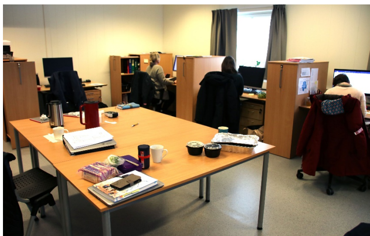
For lærerne på voksenopplæringen så er det en stor forbedring å komme til de nye lokalene. Her får de hver sin arbeidsplass i et romslig personalrom.

- Her har vi fått det veldig bra, med gode arbeidsplasser, god luft og god plass, sier lærerne ved voksenopplæringen. De siste årene har de hatt tilhold i de gamle lensmannslokalene i sentrum, og disse lokalene har ikke vært godt egnet til undervisningsformål, blant ved at de har hatt små og for få klasserom.