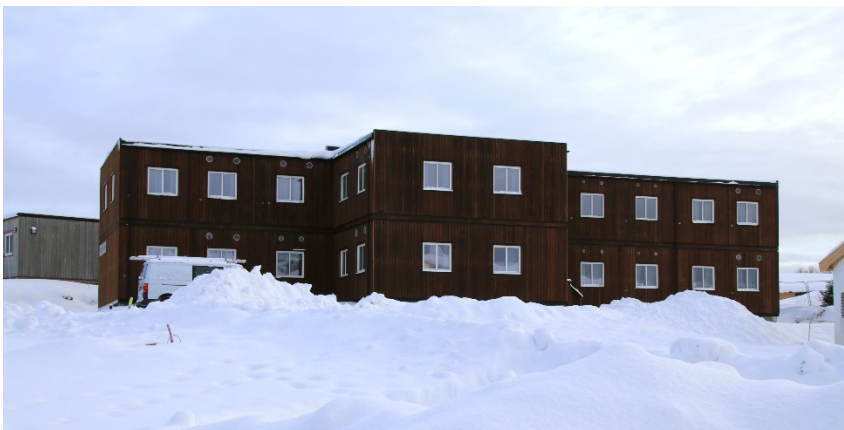
Nybygget til Voksenopplæringen og flyktningetjenesten i Vikna er plassert på skoleområdet midt mellom småskolen og nyskolen. Voksenopplæringen er en del av Rørvik skole som nå for første gang er samlet på ett område.