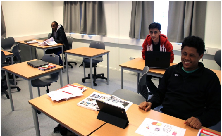
Elevene på voksenopplæringen holder til i fem like store klasserom i det nye bygget.

Voksenopplæringen i Vikna er altså underlagt Rørvik skole. Når de nå for første gang er på samme skoleområde som resten av skolen så er det en fordel for administrasjonen. Det som er enda større fordel for elevene er nærheten til Ytre Namdal videregående skole, som også ligger rett ved. Voksenopplæringen har en del samarbeid med den videregående skolen. Nærheten her er derfor også viktig.