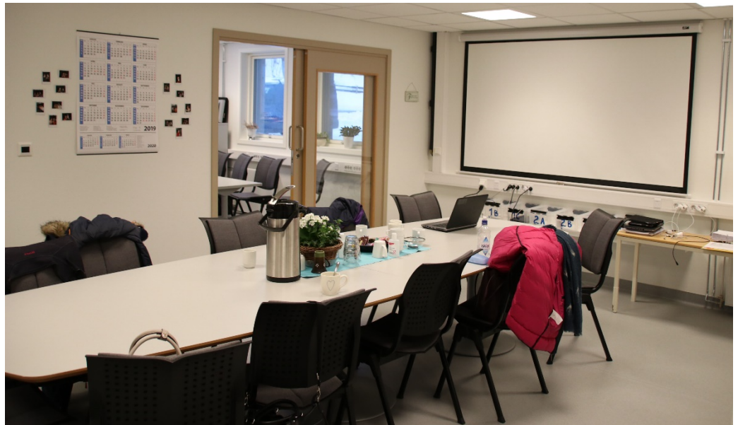
De tidligere vaskerilokalene ved Rørvik sykestue har blitt lyse og gode arbeidslokaler for de ansatte i hjemmetjenesten.

En annen stor fordel med den nye basen er at det utenfor er bygd en parkeringsgarasje. Dermed kan alle enhetens biler stå tørt, samt snø og isfrie fram til de ansatte skal ut på oppdrag. Garasjen er bygd slik at det også er parkeringsplasser oppe på taket. Dette bygget er konstruert slik at det er mulig å bygge oppå dersom det i framtiden skal bli behov for utvidelse av Sykestua.