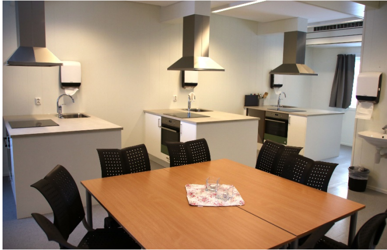
Voksenopplæringen har fått et godt skolekjøkken hvor elevene får opplæring i matlaging. Samt at de kan lage mat til hverandre.