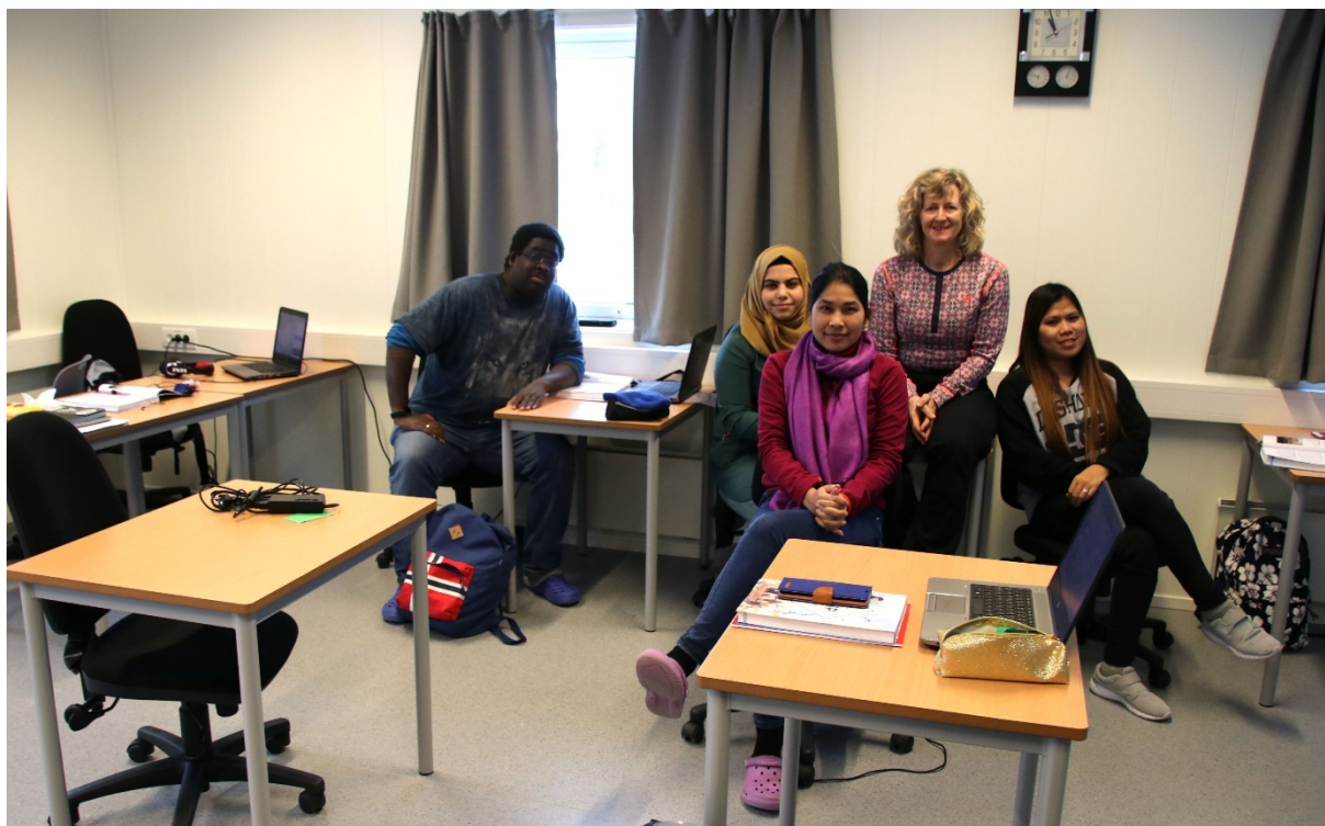
Denne gjengen og de andre elevene og lærerne på Voksenopplæringen i Vikna trives godt i sine nye lokaler. Her har de fått store klasserom og bra fellesareal.

Ved sist månedsskifte så tok voksenopplæringen og flykningetjenestene i Vikna kommune i bruk sitt helt nye bygg. De ansatte og elevene i voksenopplæringen trives godt i sine nye lokaler som er mer egnet for deres bruk enn de tidligere lokalene. Samtidig er for første gang voksenopplæringen og flykningetjenesten i Vikna samlet under samme tak.